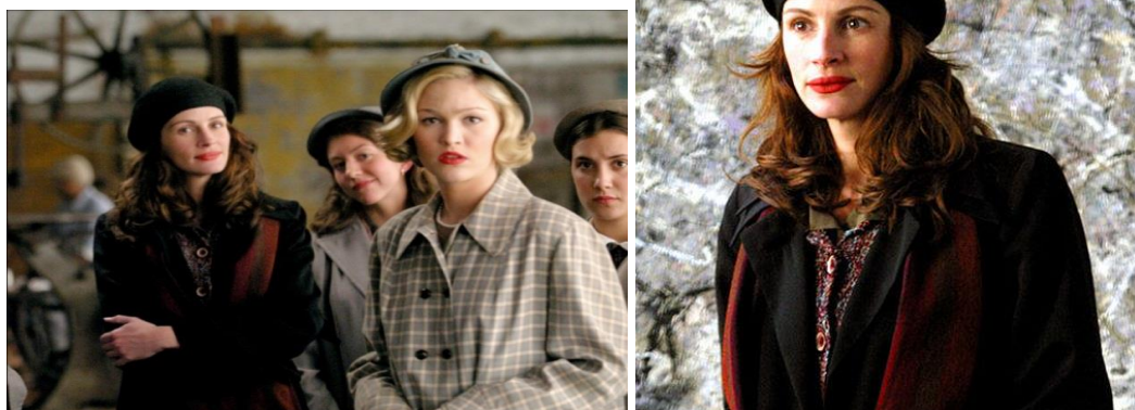
«Улыбка Моны Лизы»